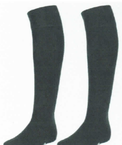
IMAGEN REFERENCIAL CALCETAS