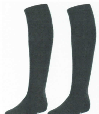
IMAGEN REFERENCIAL CALCETAS